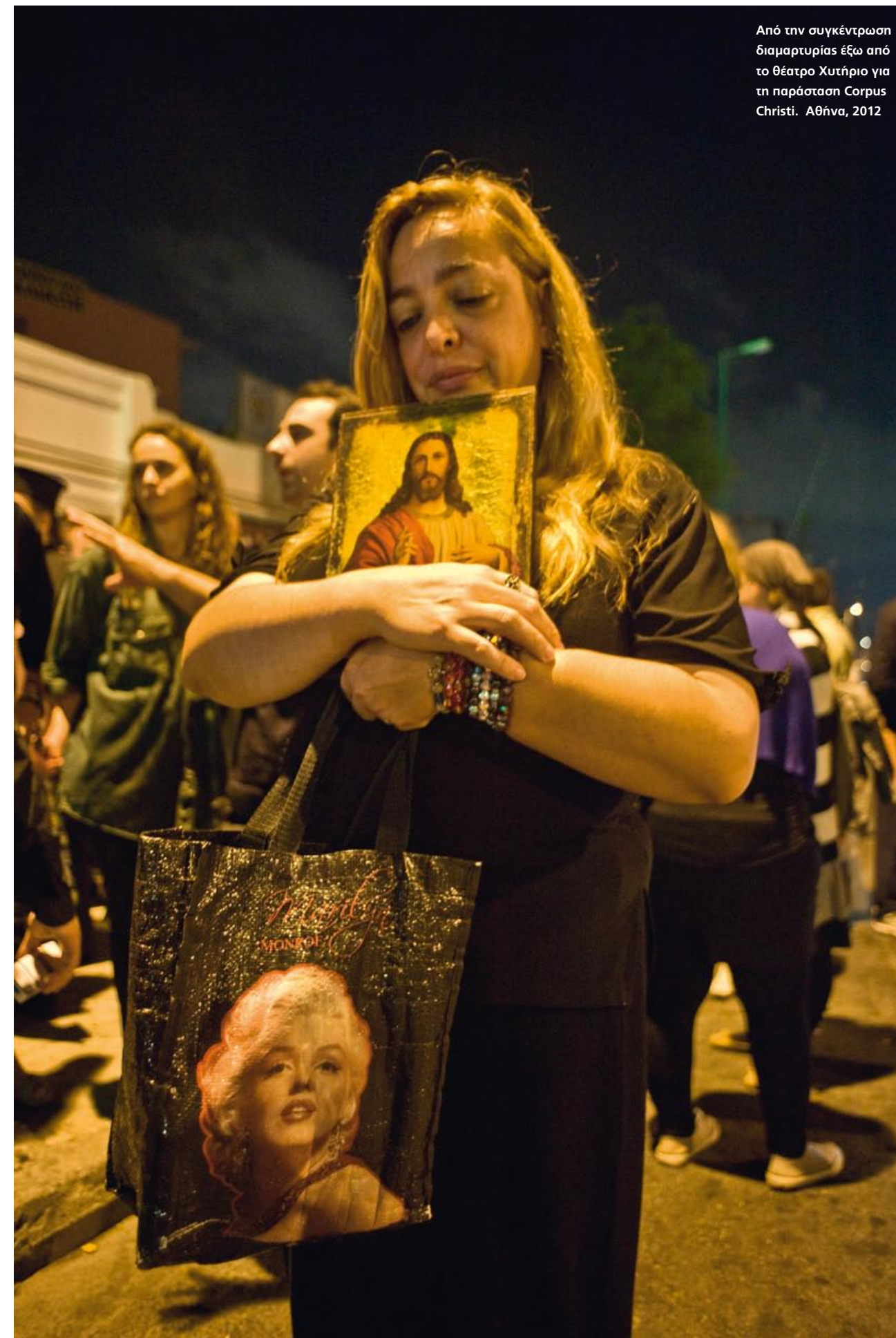
Από την συγκέντρωση διαμαρτυρίας έξω από το θέατρο Χυτήριο για τη παράσταση Corpus Christi. Αθήνα, 2012