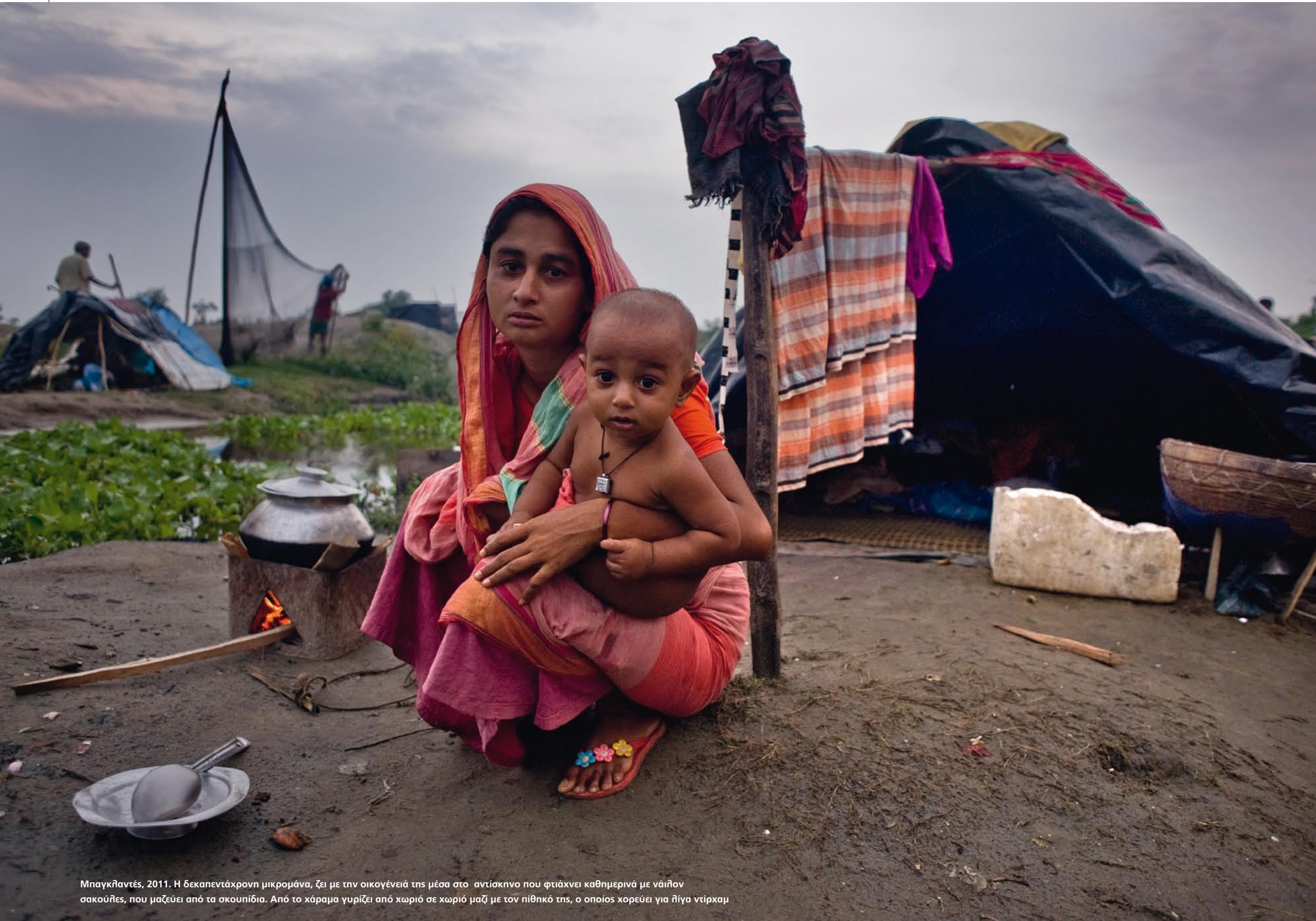
Μπαγκλαντές, 2011. Η δεκαπεντάχρονη μικρομάνα, ζει με την οικογένειά της μέσα στο αντίσκηνο που φτιάχνει καθημερινά με νάιλον σακούλες, που μαζεύει από τα σκουπίδια. Από το χάραμα γυρίζει από χωριό σε χωριό μαζί με τον πύθηκό της, ο οποίος χορεύει για λίγα ντίραχαμ