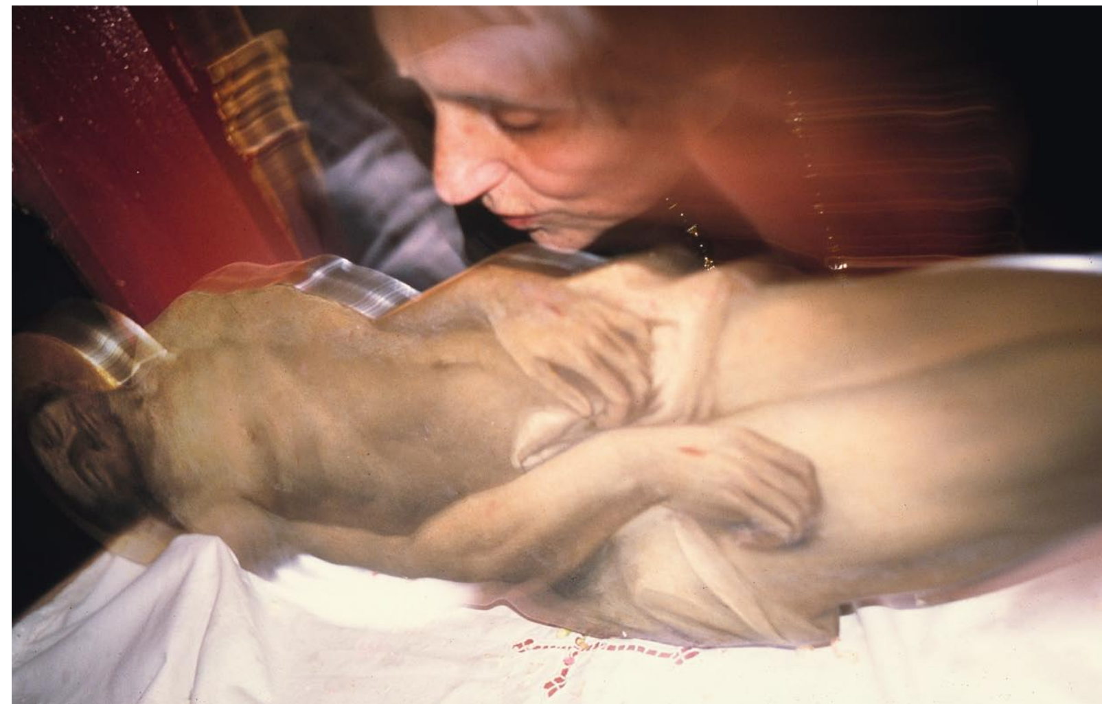
Ζάκυνθος, Μ. Παρασκευή 1996: το προσκύνημα του Αμνού