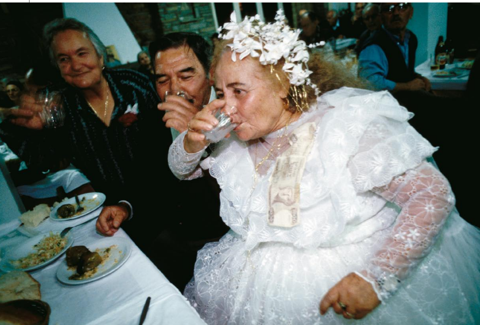
Στη Πουρτίπολη Πόζαρ της Έδεσσας, 1998. Οι ηλικιωμένοι μια μέρα για να διασκεδάσουν και να θυμηθούν τα νιάτα τους έστψαν ένα ολόκληρο - εικονικό - γλέντι γάμου