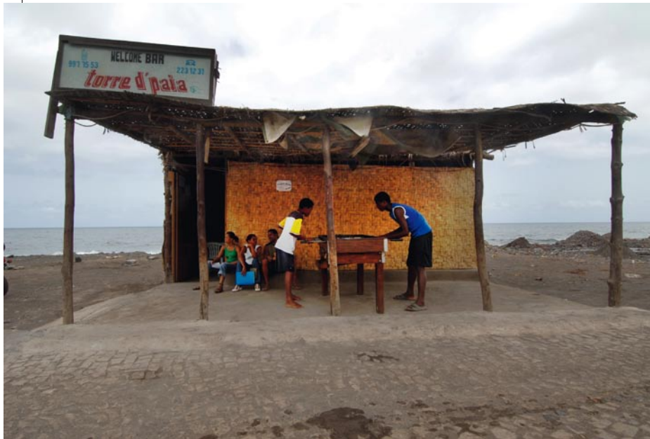
Παραλία του Σάντο Αντάο, στο νησάκι Πάουλι του αρχιεπελάγου, στο Πράσινο Ακρωτήρι. 2010