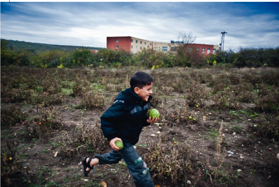
Το προσφυγόπουλο από τη Συρία έξω από το ανοικτό κέντρο κράτησης Παστρογκόρ στα Βουλγαροτουρκικά σύνορα, στο Τριεθνές, κοντά στον Έβρο. 2012